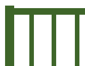
Remplissage en barreaux de 30 x 20 mm